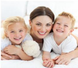
Predstavitve programa ZDAJ.

Lorem ipsum dolor sit amet, consectetur adipiscing elit. Duis tellus. Donec ante dolor, iaculis nec, gravidaac, cursus in, eros. >