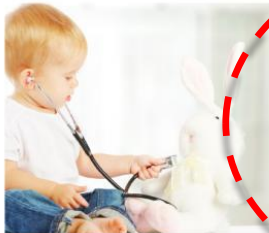
Kam in kdaj na pregled?

Lorem ipsum dolor sit amet, consectetur adipiscing elit. Duis tellus. Donec ante dolor, iaculis nec, gravidaac, cursus in, eros. >