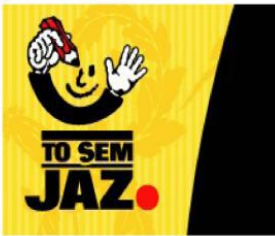
Spletna svetovalnica za mladostnike To sem jaz

Lorem ipsum dolor sit amet, consectetur adipiscing elit. Duis tellus. Donec ante dolor, iaculis nec, gravidaac, cursus in, eros. >